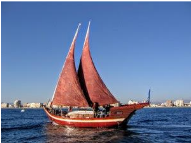
L'Obock, labellisé BIP en 2007

Le 4 décembre 2016 a été créée une Académie de Voile Latine par la Fédération du Patrimoine Maritime Méditerranéen (FPMM), pour maintenir vivant l'art de la navigation sous voile latine, patrimoine immatériel de l'humanité.