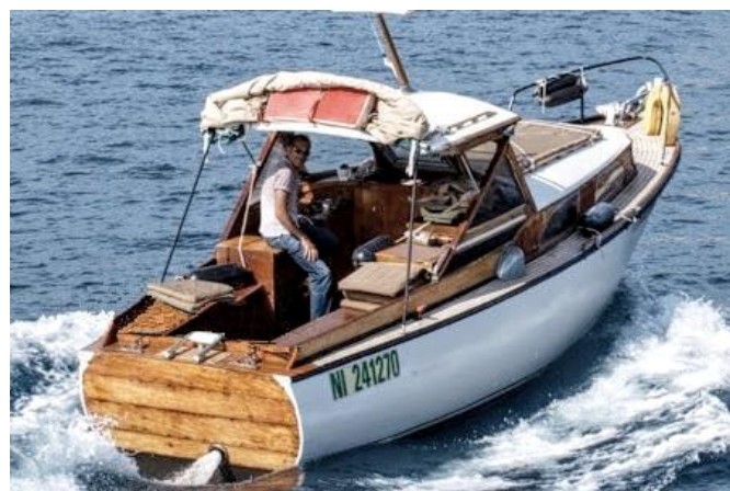
La Kémia,, labellisé BIP en 2015

de voir le jour entre les 2 seuls Bateaux d'Intérêt Patrimonial du pays « nissart ». La yole de Villefranche-sur-mer, Laïssa Ana, réplique historique d'une embarcation de la Marine Nationale de 1796, peut naviguer soit à la voile soit à l'aviron (mâts retirés). Longue (11,64 m) et étroite (2,05 m), la yole est peu profonde (0,50 m de tirant d'eau). Elle pèse une tonne à vide. Le bateau, labellisé BIP en 2013, n'est pas motorisé.