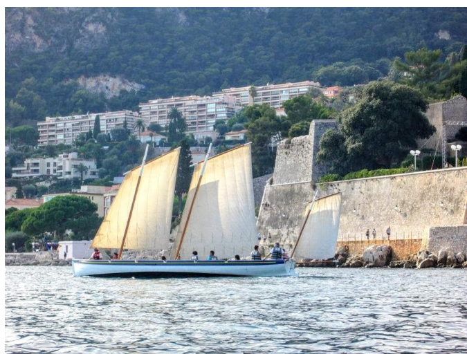
Laïssa Ana,, labellisé BIP en 2013, Yolevillefranche.com

Depuis l'arrivée en 2016 d'un BIP au port de Villefranche-sur-mer une association est en train